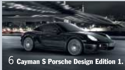
6 Cayman S Porsche Design Edition 1.