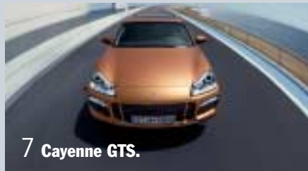
7 Cayenne GTS.