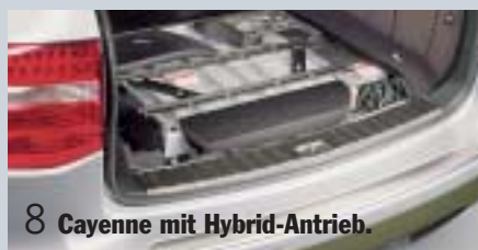
8 Cayenne mit Hybrid-Antrieb.